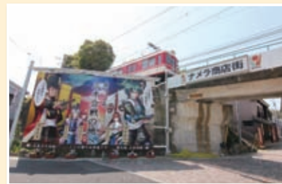
ナメラ商店街出入り口の大看板

地元の活性化やまちおこしなどに取り組む三木城下町まちづくり協議会がリニューアルしたナメラ商店街出入り口にある大看板「MIKI Welcome Board」。