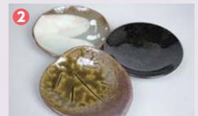
※写真は一例です。当選者1名につきプレゼントする丹波焼小物は1点です。