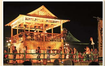
デカンショ祭の木造ヤグラと篠山城跡

毎年8月15日16日に開催される「丹波篠山デカンショ祭」。今年4月には、「丹波篠山 デカンショ節-民謡に乗せて歌い継ぐふるさとの記憶」として、デカンショ節に唄われる丹波篠山が日本遺産に認定されました。